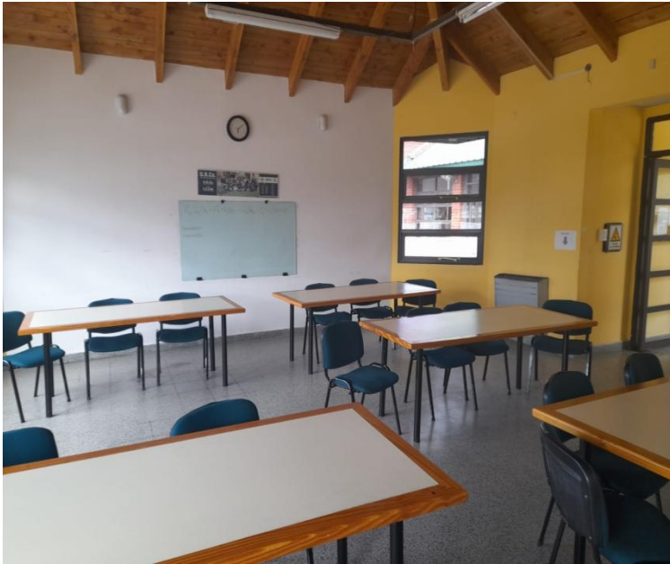
Aula prof. Hugo Medeot.

Posee además un aula híbrida para 70 personas con tecnología de última generación adquirida en febrero de 2022.