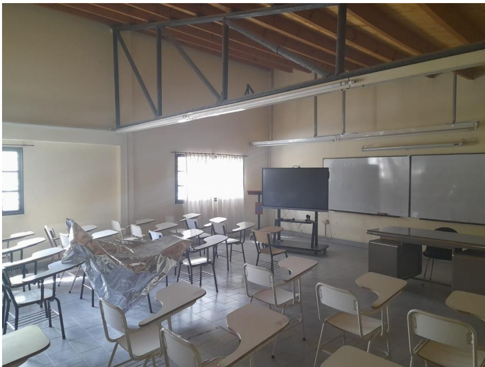
Aula profesor Ing Marquina

Posee además un aula híbrida para 70 personas con tecnología de última generación adquirida en febrero de 2022.