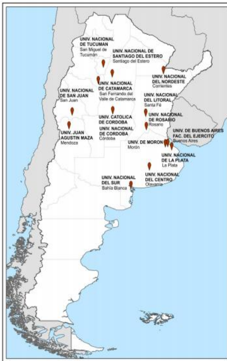
Distribución Geográfica de las Universidades donde se dicta la carrera de Agrimensura 20

No existe el dictado de la Carrera de Ingeniero Agrimensor en ninguna de las Universidades localizadas en la Región Patagónica. Por lo tanto el Area de influencia de esta carrera propuesta en el Asentamiento Universitario Zapala, debería considerarse de interés para toda la Región Patagónica.