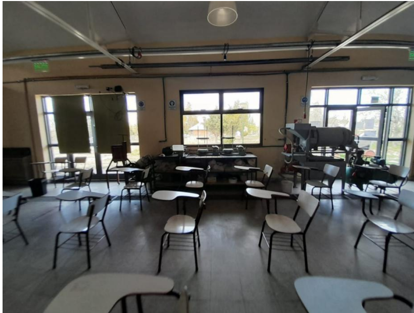
Aulas Plantas de tratamiento y gabinete Topográfico.

Se dispone también de un Aula de tratamiento para 70 personas y todo el equipamiento tecnológico necesario.